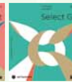
セレクトギフト ファッション&グルメ (全 12 コース)