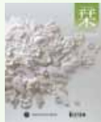
ギフト オブ メモリアル葉 (全 12 コース)