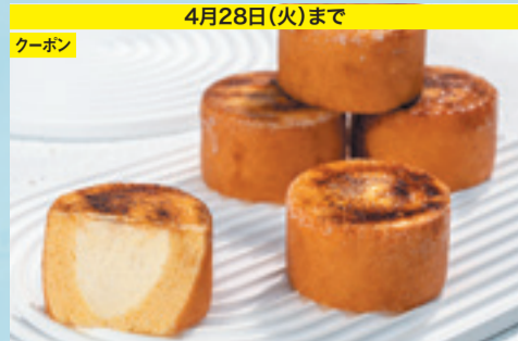
4月28日(火)まで クーポン 【小樽市/小樽石蔵バウム】 プリュレカスタードインバウム 567円(1個)