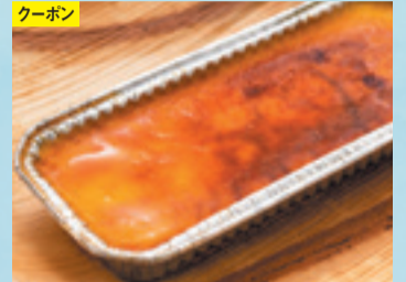
【札幌市/キッチンアクティブ】 カタラーナ 1,836円(190g)