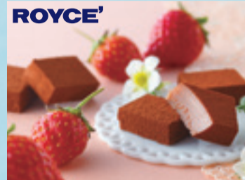
【札幌市/ロイズ】 生チョコレート[ストロベリー] 1,215円(20粒入)