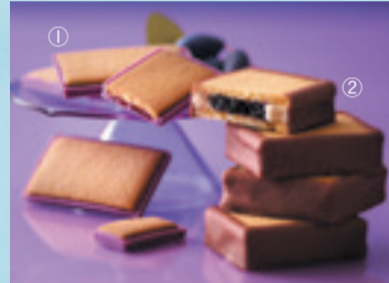
【千歳市/morimoto】 ①北の散歩道ハスカップ 1,181円(8個入) ②ハスカップジュエリー 1,281円(4個入)