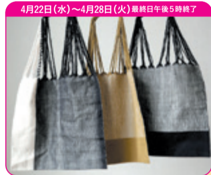
4月22日(水)～4月28日(火) 最終日午後5時終了 手織り生地を使ってメキシコで作られた「ハンモックバッグ」。布の端のフリンジをそのまま編みあげて持ち手にしています。 〈ザ・エスノースギャラリー〉 ハンモックバッグ 各9,790円(綿100% / 約37x40cm) 〈ザ・エスノースギャラリー〉期間限定販売 □2階 スライス オブ ライフ