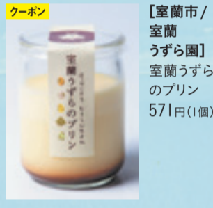
クーポン 【室蘭市/室蘭 うずら園】 室蘭うずらのプリン 571円(1個)