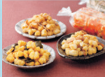
【砂川市/北菓楼】 北海道開拓おかし各種 491円から(170g)