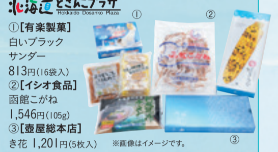
北海道 道産品プラザ ①【有楽製菓】 白いブラックサンダー 813円(16袋入) ②【イシオ食品】 函館こがね 1,546円(105g) ③【壺屋総本店】 き花 1,201円(5枚入) ※画像はイメージです。