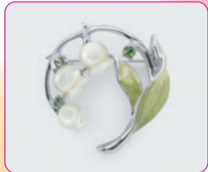
すずらの花言葉は「幸福の再来」「純粋」「癒し」。大切な方へのギフトとしておすすめです。 〈ヴァンドームブティック〉 ブローチ 22,000円(合金・白蝶貝・合成樹脂・ガラス/ 縦約32x横約32mm) □1階 ヴァンドームブティック