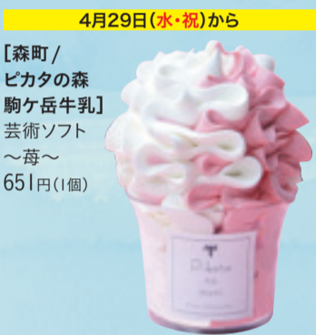
4月29日(水・祝)から 【森町/ピカタの森 駒ヶ岳牛乳】 芸術ソフト ～苺～ 651円(1個)