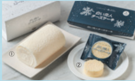
【札幌市/ISHIYA】①白い恋人ロールケーキ 1,890円(1個) ②白い恋人チーズケーキ 897円(2個) ③白い恋人 1,145円(12枚入) ④美冬(みふゆ)こがれ雪 987円(いちご・オレンジ・アップル/各2個) ⑤チョコレートタブレット (白い恋人ホワイト・白い恋人ブラック・焦がしキャラメル・ミックスベリー・抹茶ミルク) 各378円(1枚)