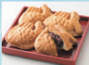
【札幌市/たいやき一休】北海道小豆のつぶあんたい焼き 201円(1個)