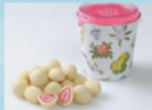
【帯広市/六花亭】ストロベリーチョコ(ホワイト) 820円(130g)