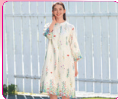
色とりどりの花が織りなす生命力豊かなデザイン。希望や明るさといった「オアシス」をイメージしたプリント柄です。 〈UCHINO/ウチノ〉 マシュマロガーゼ ブルーム ワンピース 27,500円(綿100%/M・L) □6階 UCHINO