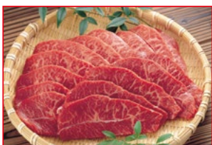
〈肉処 壱丁田〉国産牛切り落とし 焼肉用 5kg限り 880円 (100gあたり)