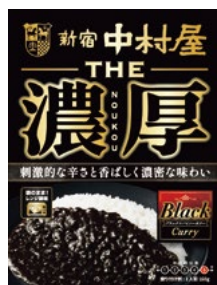
〈新宿中村屋〉THE濃厚 ブラック スパイシーカレー 40点限り 324円 (160g)