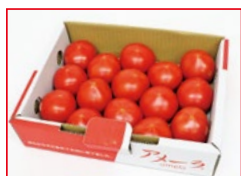
〈グリーンワールド〉 静岡県産他 アメーラトマト 50点限り 1,080円 (1箱)