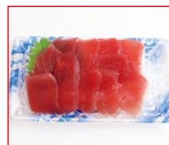
〈東信水産〉キハダマグロ切り落とし 各日20点限り 598円 (1パック)