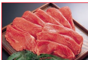
〈肉処 壱丁田〉国内産 黒毛和牛切り落とし すき焼用 5kg限り 780円 (100gあたり)