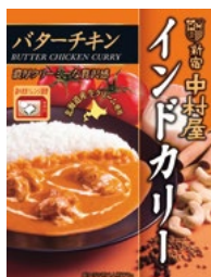
〈新宿中村屋〉インドカレー バターチキン 25点限り 399円 (170g)