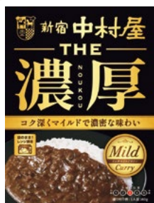
〈新宿中村屋〉THE濃厚 リッチマイルド カレー 40点限り 324円 (160g)