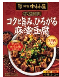
〈新宿中村屋〉本格四川 コクと旨み、ひろがる麻婆豆腐 20点限り 299円 (155g)