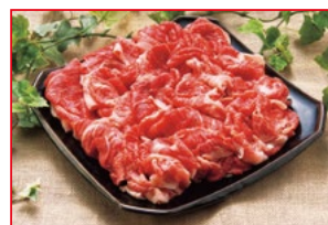
〈肉処 壱丁田〉国産牛小間切れ 5kg限り 480円 (100gあたり)

伊勢丹は、地階・1階は午前10時～午後7時まで営業。2階～8階・別館コリドーは午前10時～午後6時30分の営業。