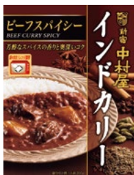
〈新宿中村屋〉インドカレー ビーフスパイシー 25点限り 399円 (200g)