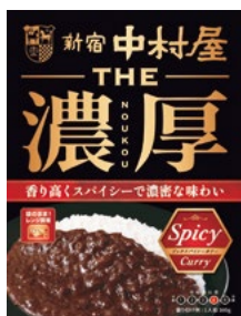
〈新宿中村屋〉THE濃厚 リッチ スパイシーカレー 40点限り 324円 (160g)