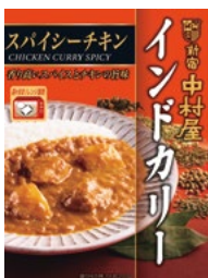
〈新宿中村屋〉インドカレー スパイシーチキン 25点限り 399円 (200g)