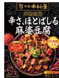
〈新宿中村屋〉本格四川 辛さ、ほとばしる麻婆豆腐 20点限り 299円 (155g)