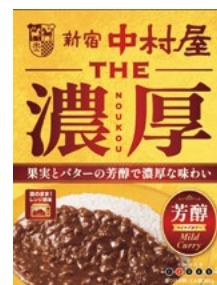
〈新宿中村屋〉THE濃厚 濃厚芳醇 マイルドカレー 40点限り 324円 (160g)