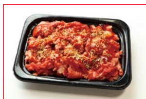
〈肉処 壱丁田〉国内産 黒毛和牛 ブルコギ 5kg限り 378円 (100gあたり)