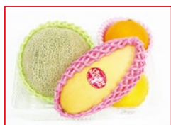
〈グリーンワールド〉 フルーツスペシャルパック 30セット限り 1,296円 (1トレー)