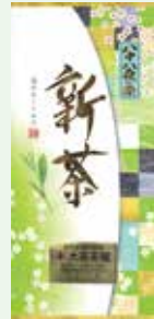
栽培農家の 八十八夜新茶 1,080円 (100g) お渡し予定日: 5月4日(月・祝)頃から

自家工場にて伝統製法の手揉み技術を活かした熟練の製造方法で茶葉を製造。 清流と緑溢れる山の傾斜地にある茶畑が多い駿河区丸子の地で1930年頃から静岡茶を作り続けております。さわやかな香りとバランスの良い旨味が特徴です。