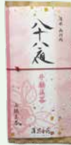
②手摘み八十八夜新茶 2,160円 (80g) お渡し予定日:5月5日(火・祝)頃から