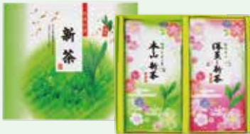
新茶平箱セット (本山新茶と深蒸し新茶) 2,700円 (100g×2袋) お渡し予定日: 5月2日(土)頃から