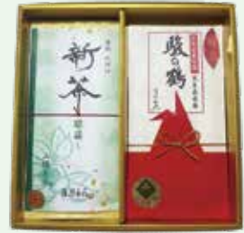
お茶の実から育てた稀少茶実生在来茶と両河内の山々の新緑の爽やかな香りと旨みをセットにしました。 両河内新茶と山のお茶100選受賞茶 【実生在来茶 駿の鶴ギフト】3,560円 (100g+50g) お渡し予定日:5月22日(金)頃から