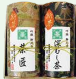
静岡県茶手揉保存会茶匠の資格を持つ 大高一彦氏による特上煎茶と、熱いお湯で 入れてもまろやかな深蒸し茶のセット。 新茶茶匠煎茶と深蒸し茶缶入りセット 3,240円 (120g入缶×2) お渡し予定日:5月4日(月・祝)頃から