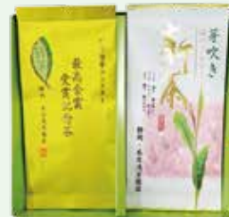
新茶芽吹きと 最高金賞受賞記念新茶 2,268円 (70g×2袋) お渡し予定日: 4月29日(水・祝)頃から