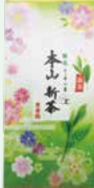
本山新茶 1,350円 (100g) お渡し予定日:5月2日(土)頃から