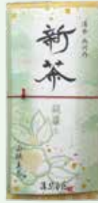
①両河内八十八夜 1,620円 (100g) お渡し予定日:5月10日(日)頃から