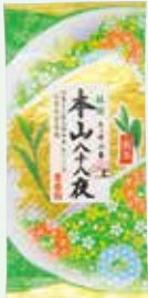
本山八十八夜 1,080円 (80g) お渡し予定日:5月4日(月・祝)頃から

安倍川本流域、家康公ゆかり本山茶。 歴史に裏打ちされた気品あふれる新茶。 明るい黄緑色、香り高く清涼感があるのが特徴。