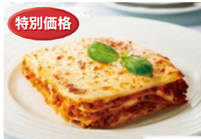
〈帝国ホテルキッチン〉 ラザーニャ ポローニャ風 48点限り 1,080円(280g)