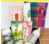
〈大井川協同組合〉 お楽しみセット 20セット 限り 1,620円(1セット)