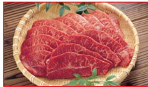
〈肉処 壱丁田〉国産牛切り落とし 焼肉用 5kg限り 880円(100gあたり)