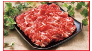
〈肉処 壱丁田〉国産牛小間切れ 5kg限り 480円(100gあたり)

伊勢丹は、地階・1階は午前10時~午後7時まで営業。2階~8階・別館コリドーは午前10時~午後6時30分の営業。