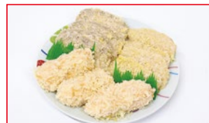
〈東信水産〉フリスベシャルセット 各日 20セット限り 880円 (はんぺんフライ4枚・イカフライ 4枚・コロケ3個/1セット)