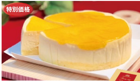
〈帝国ホテルキッチン〉ペストリーシェフ のチーズケーキ 24点限り 1,296円(335g)