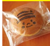
〈長坂養蜂場〉ふんふんの はちみつバターどら焼き 50点限り 250円(1個)