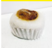
〈松木屋〉 うさぎもち 60点限り 195円(1個)