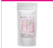
〈錦園石部商店〉 さくらかおり 1,296円(80g)