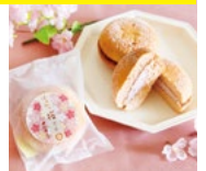
〈長坂養蜂場〉 はちみつ桜プッセ 40点限り 221円(1個)