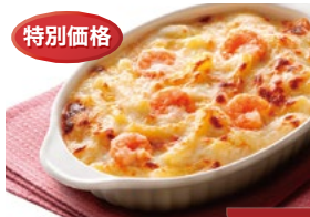
〈帝国ホテルキッチン〉 海老のマカロニ グラタン 60点限り 599円(200g)