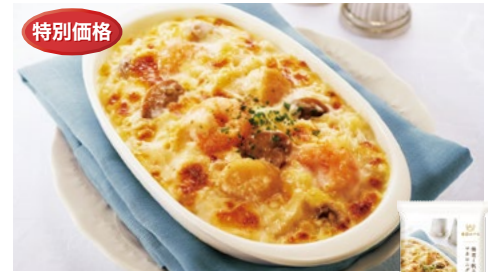
〈帝国ホテルキッチン〉海老と帆立の マカロニグラタン 48点限り 972円(220g)