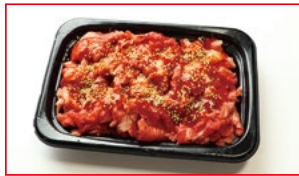
〈肉処 壱丁田〉国内産 黒毛和牛 ブルコギ 5kg限り 378円(100gあたり)