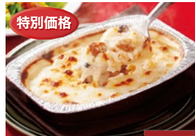
〈帝国ホテルキッチン〉 海老のドリア 60点限り 599円(190g)