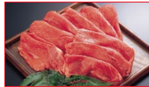
〈肉処 壱丁田〉国内産 黒毛和牛切り落とし すき焼用 5kg限り 780円(100gあたり)