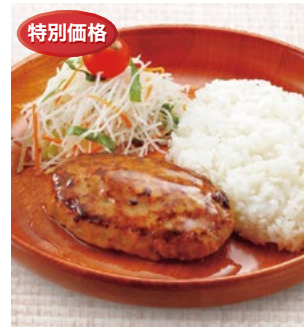
〈びっくりドンキー〉 乳・小麦・卵を使わない ハンバーグ 100点限り 756円 (260g) ポテトミルフィーユ グラタン 48点限り 594円 (325g)