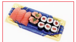
〈東信水産〉まぐろづくし 各日20点限り 680円(1折)