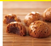
〈春華堂〉 味噌まんじゅう 50点限り 133円(1個)