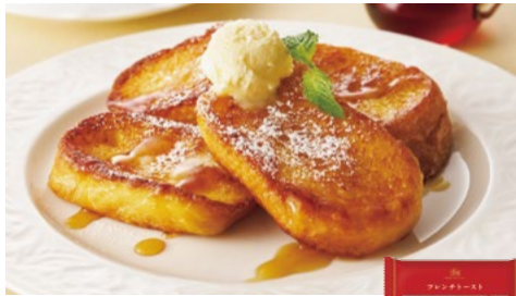
〈帝国ホテルキッチン〉フレンチトースト 40点限り 972円(210g)

※なくなり次第終了とさせていただきます。※画像はイメージです。 ※すべて冷凍販売となります。