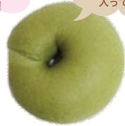
抹茶ホワイトチョコ 280円 (1個)

きめ細かく口あたり なめらかな抹茶を使用。 中はホワイトチョコが 入っています。