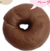
チョコ 280円 (1個)