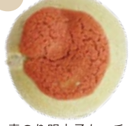
青のり明太子もっチーズ 320円 (1個)

青のりを練り込んだ ベーグルの中に 明太子&チーズ&もちが 入っていて よりモチモチ!