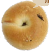
あんバター 280円 (1個)