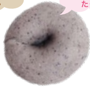
ブルーベリークリーム チーズ 300円 (1個)

きめ細かく口あたり なめらかな抹茶を使用。 中はホワイトチョコが 入っています。