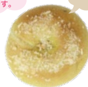
甘口野菜カレー 330円 (1個)

青のりを練り込んだ ベーグルの中に 明太子&チーズ&もちが 入っていて よりモチモチ!