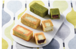
〈京らく製あん所〉 あんビスキュイ 60点限り 1,350円 (4個入)