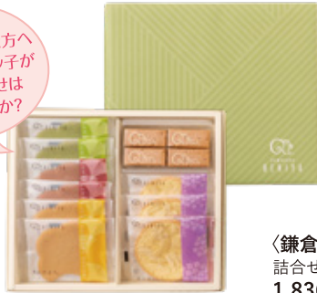
〈鎌倉紅谷〉 詰合せ02 80点限り 1,836円 (1箱)

これから お世話になる方々へ、 可愛く個包装された 人気のかりんとうが オススメです。