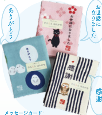
メッセージカード 代わりにご使用いただけます。 ↑〈濱文様〉 ひとはんかち各種 660円 (綿100%)