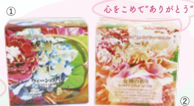
おせりわに しました おせりわに しました ほんの もち