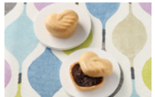
〈清月堂本店〉 あいさつ最中 80点限り 605円 (2個入)