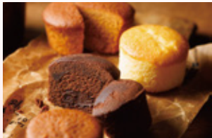
〈石村萬盛堂〉 プチガトー (ショコラ、フロマージュ、キャラメル) 60点限り 1,361円 (各2個/6個入)