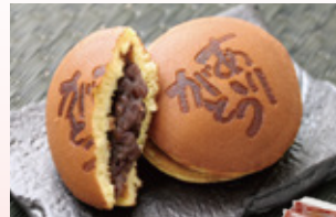
〈玉華堂〉 ありがとう だら焼き 30点限り 1,356円 (5個入)