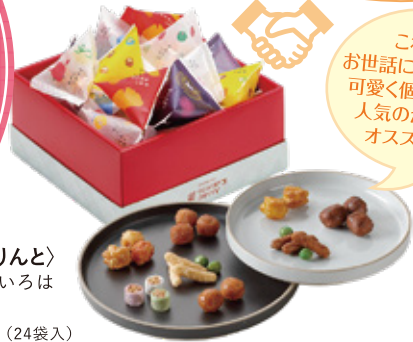
〈麻布かりんと〉 かりんといろは 100点限り 1,350円 (24袋入)

これから お世話になる方々へ、 可愛く個包装された 人気のかりんとうが オススメです。