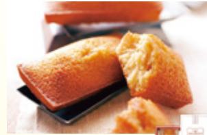
〈ノワ・ドゥ・プール〉 フィナンシェ 5個入 60点限り 1,728円 (5個入)