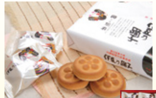
〈間瀬〉 伊豆乃踊子 30点限り 1,350円 (10個入)