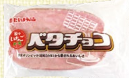
〈山形/たいようパン〉 粒々いちごベタチョコ 30点限り 345円(1個)