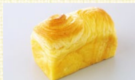
〈栃木/金谷ホテルベーカリー〉 カマンベールBOX 20点限り 270円(1個)