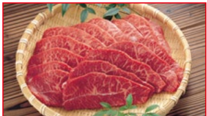
〈肉処 壱丁田〉国産牛切り落とし 焼肉用 5kg限り 880円(100gあたり)