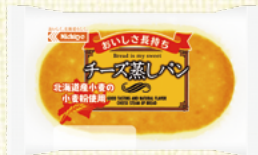
〈北海道/日糧製パン〉 チーズ蒸しパン 36点限り 233円(1個)