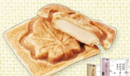
〈岡山/ベイクラボ〉 クロワッサンもみじ各種 各24点限り 各270円(1個)