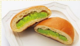
〈宮城/あおばずんだ 本舗)ZUNDAあんぱん 30点限り 270円(1個)