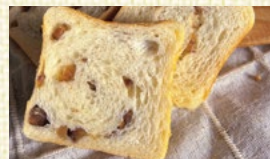
〈兵庫/がじゅまる〉 甘栗ブレッド 12点限り 972円(1本)