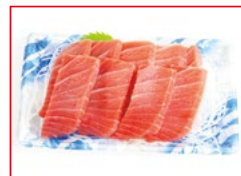
〈東信水産〉南マグロ切り落とし 各日20点限り 598円(1パック)