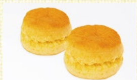
〈東京/ベノア〉 スコンプレーン 15点限り 605円(2個入)