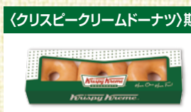
〈クリスピークリームドーナツ〉期間限定販売 2月27日(金)限りの販売 〈クリスピークリームドーナツ〉 オリジナル・グレイズド ボックス 3個入 80点限り 615円