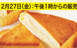
2月27日(金):午後1時からの販売 〈大分/つるさき食品〉 三角チーズパン 150点限り 341円(1個)