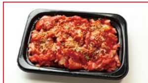
〈肉処 壱丁田〉国内産 黒毛和牛 ブルコギ 5kg限り 378円(100gあたり)