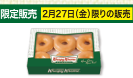
〈クリスピークリームドーナツ〉 オリジナル・グレイズド ボックス 6個入 40点限り 1,080円