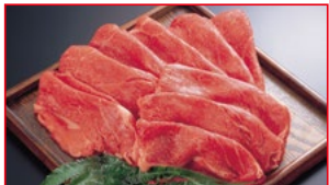
〈肉処 壱丁田〉国内産 黒毛和牛切り落とし すき焼用 5kg限り 780円(100gあたり)