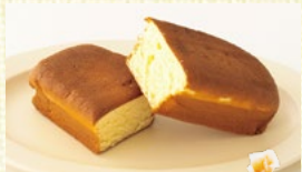
〈北海道/島川製菓〉 ミルクカステラ 24点限り 594円(5本入)