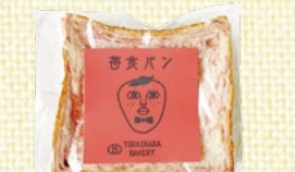
〈愛媛/月原ベーカリー〉 いちご食パン 30点限り 486円(3枚入)