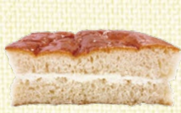
〈長野/ピクニック〉 牛乳パン 36点限り 341円(1個)