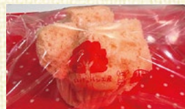
〈岐阜/リリアント〉 ロバのパン各種 各10点限り 各357円(1個)