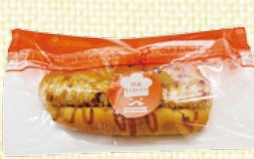
〈滋賀/柏屋製パン〉 丸ごと1本ちくわパン 40点限り 357円(1個)