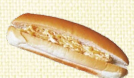
〈滋賀/柏屋製パン〉 たくまヨパン 40点限り 324円(1個)