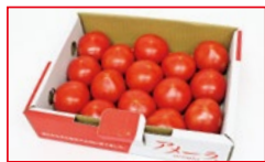
〈グリーンワールド〉 静岡県産他 アメーラトマト 50点限り 1,080円(1箱)