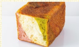
〈京都/祇園ポロニア〉 ポロニア苺三色 5点限り 1,156円(1個)