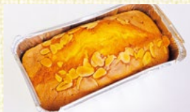
〈兵庫/トミーズ〉 パウンドケーキ 10点限り 1,080円(1個)