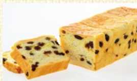
〈山梨/八ヶ岳パン〉 クルミの入ったクリームレーズン 20点限り 1,404円(1本)