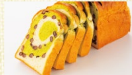
〈栃木/金谷ホテルベーカリー〉 抹茶大納言 10点限り 1,350円(1個)