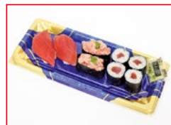
〈東信水産〉まぐろづくし 各日20点限り 698円(1折)