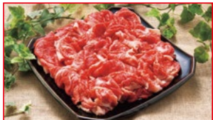
〈肉処 壱丁田〉国産牛小間切れ 5kg限り 480円(100gあたり)

伊勢丹は、地階・1階は午前10時～午後7時まで営業。2階～8階・別館コリドーは午前10時～午後6時30分の営業。