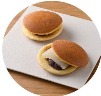
〈石川/ひっぱり餅本舗〉 ひっぱりどら 324円