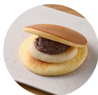
〈福島/どら焼き専門店 丹坊〉 琥珀 301円