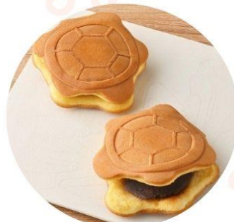
〈埼玉/亀屋〉 亀どら(こし) 303円