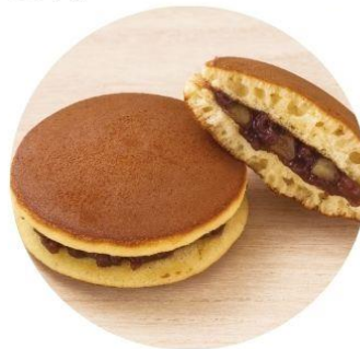
〈岐阜/松月堂〉 円坐 281円