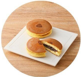
〈石川/森八〉 夢香山 195円

王道の小豆餡やお餅入りなど、バリエーション豊かに取り揃えました。 どら焼き皮と餡が織りなすハーモニーを楽しみながら、お気に入りのおいしさを見つけてください。