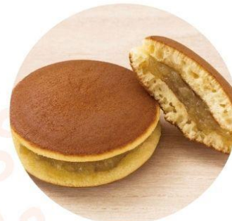
〈岐阜/松月堂〉 中津川栗きんとんどらやき 281円