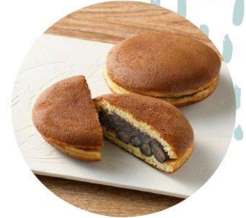
〈大阪/丹波の黒太郎〉 黒豆どら焼き 324円