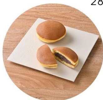
〈東京/茂助だんご〉 どら焼 261円