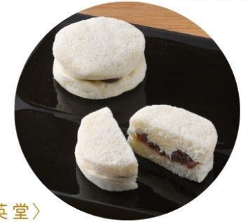
〈島根/三英堂〉 ふんわり蒸したミルク薫る白どら 292円