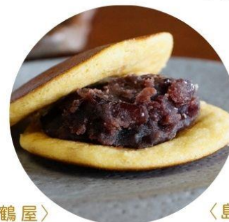
〈京都/丹波鶴屋〉 どら焼き「丹波大納言小豆」 411円