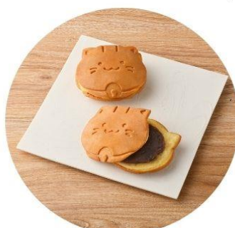
〈埼玉/亀屋〉 たまどら 303円