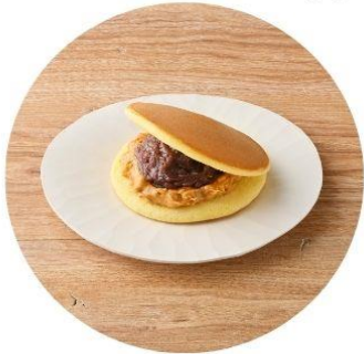
〈福島/どら焼き専門店 丹坊〉 落花生 321円