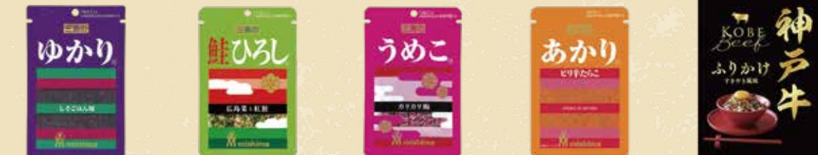
ゆかり 30点限り 148円 (20g)