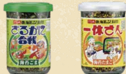
ざるかに合戦 20点限り 299円 (48g)