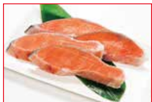
〈魚武〉 塩銀鮭 (甘口・養殖) 20点限り 980円 (4切)