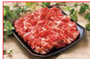
〈肉処 吉丁田〉国産牛小間切れ 5kg限り 480円 (100gあたり)