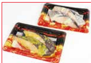
〈魚武〉 銀だら西京漬・ 粕漬各種 20点限り 各 698円 (2切)