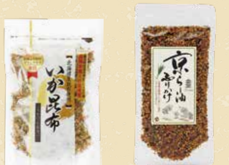
いか昆布 60点限り 399円 (80g)