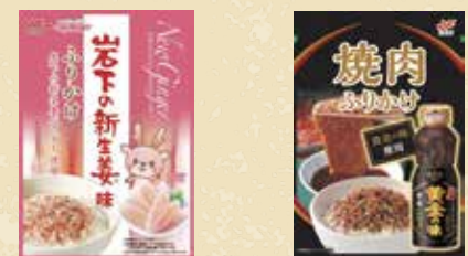
岩下の新生姜ふりかけ 30点限り 119円 (20g)