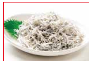
〈魚武〉 金揚げしらす 20点限り 398円 (100g)