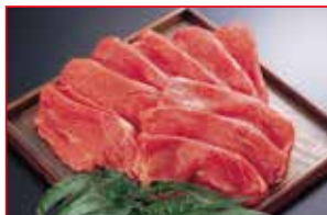
〈肉処 吉丁田〉国内産 黒毛和牛切り落とし すき焼用 5kg限り 780円 (100gあたり)