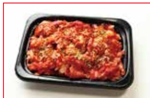
〈肉処 吉丁田〉国内産 黒毛和牛 ブルコギ 5kg限り 378円 (100gあたり)