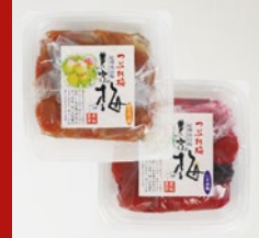
〈中峰農園〉 つぶれ梅 はちみつ漬け・しそ漬各種 各60点限り 899円 (400g)