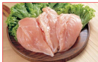
〈肉処 荅丁田〉鹿児島県産 薩摩錦 ちぎんむね肉 24kg限り 68円 (100gあたり)