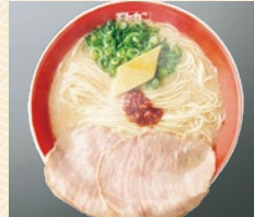
久留米 モヒカンラーメン 味家 20点限り 540円 (2人前)