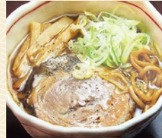
富山ブラックラーメン 誠や 20点限り 594円 (280g)