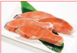
〈魚武〉 塩銀鮭 (甘口・養殖) 20点限り 798円 (4切)