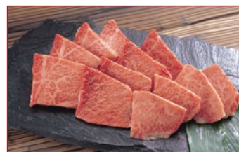
〈肉処 荅丁田〉国内産 黒毛和牛切り落とし 焼肉用 10kg限り 780円 (100gあたり)