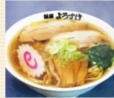
佐野ラーメン 麵屋ようすけ 20点限り 540円 (2人前)