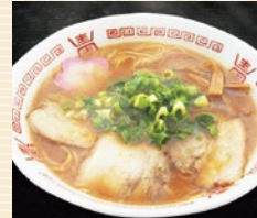
和歌山中華そば 正善(小) 20点限り 540円 (110g×2)