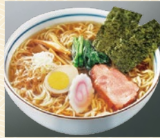
比内地鶏ラーメン 32点限り 399円 (2人前)