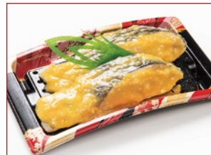
〈魚武〉 銀だら西京漬 20点限り 698円 (2切)