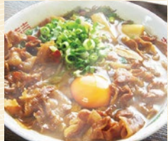
徳島ラーメン 奥屋 20点限り 540円 (2人前)