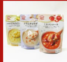
〈(MCC)スープ お試しセット 40セット限り 499円 (クラムチャウダー・ ミネストローネ・ とうもろこしスープ 3種類各1点)