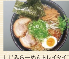
しじみらーめん トレイタイプ (焦がし風しょうゆ味) 20点限り 399円 (2人前)