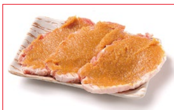
〈肉処 荅丁田〉国産 和豚もちふたのロース 味噌漬け 30点限り 699円 (3枚入/1パック)