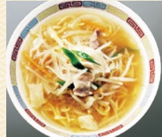
袋入八幡浜ちゃんぽん (2食) 32点限り 399円 (2人前)