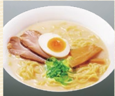
横浜 皇朝 海老鶏白湯ラーメン 20点限り 540円 (2人前)