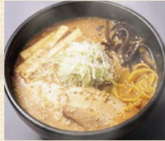
札幌のラーメン 吉山商店 20点限り 540円 (2人前)