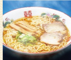
高山ラーメン 桔梗屋 20点限り 540円 (220g)