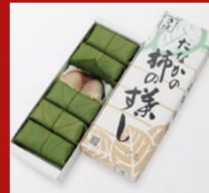
〈柿の葉寿司〉 鯖 16点限り 1,026円 (6個)