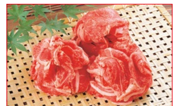
〈肉処 荅丁田〉山形県産 山形牛乙姫 小間切れ 10kg限り 598円 (100gあたり)

伊勢丹は、地階・1階は午前10時~午後7時まで営業。2階~8階・別館コリドーは午前10時~午後6時30分の営業。