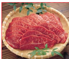
〈肉処 吉丁田〉国産牛 切り落とし焼肉用 5kg限り 780円(100gあたり)