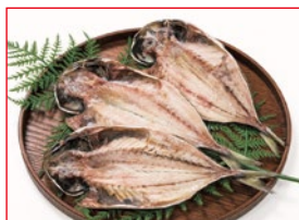
〈魚武〉 真あじの 開き 20点限り 698円(3枚)