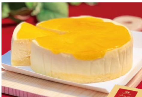
ペストリーシェフのチーズケーキ 各日12点限り 1,512円(335g)