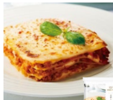
ラザーニャ ポローニャ風 各日12点限り 1,188円(280g)