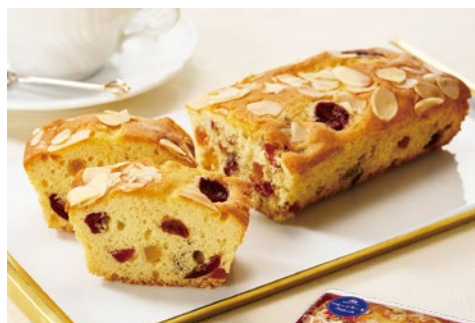
パウンドケーキ フルーツケーキ 各日12点限り 1,512円(180g)