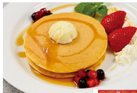
ペストリーシェフのパンケーキ 各日12点限り 756円(180g/2枚×2袋)