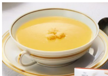
クリームコーンスープ 各日15点限り 648円(180g)