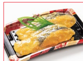
〈魚武〉 銀だら 西京漬 20点限り 698円(2切)