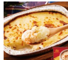
海老のドリリア 各日48点限り 648円(190g)