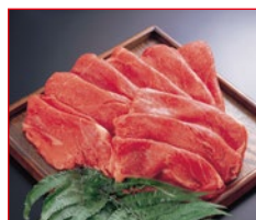
〈肉処 吉丁田〉国内産黒毛 和牛切り落としすき焼用 5kg限り 780円(100gあたり)