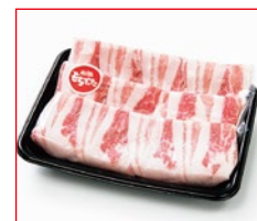
〈肉処 吉丁田〉国産和豚 もち豚バラしゃぶしゃぶ用 5kg限り 298円(100gあたり)