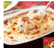
きこの香る チキンドリア 各日24点限り 648円(190g)