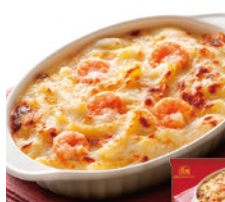
海老のマカロニ グラタン 各日48点限り 648円(200g)