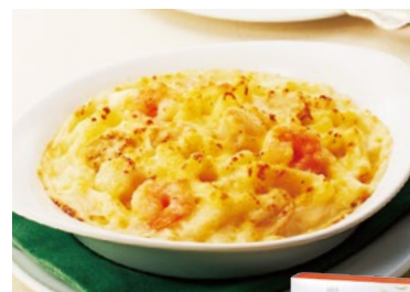
シーフードマカロニグラタン 各日15点限り 1,296円(250g)