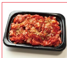
〈肉処 吉丁田〉国内産黒毛 和牛ブルコギ焼肉用 5kg限り 378円(100gあたり)