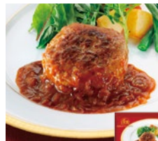
グリルハンバーグ オニオンソース 各日12点限り 899円(130g)