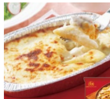
チキンのペンネ グラタン 各日24点限り 648円(200g)