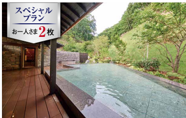
③⑦ ルグラン軽井沢ホテル & リゾート