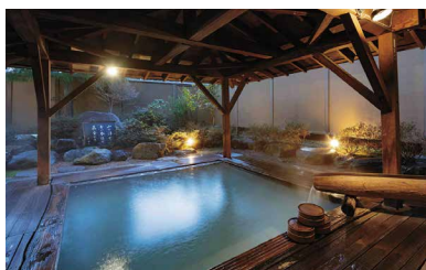
④ 陽日の郷 あづま館

※エムアイカード プラス、伊勢丹アイカード、三越 M CARD、MICARD、各種クレジットカードがご利用いただけます。(1回払いのみ) ※エムアイ友の会発行のお買物カードおよびお買物券はご利用いただけません。※各種ご優待対象外の商品となります。※一部ご利用いただけない商品券がございます。※エムアイポイントは、エムアイカードご利用額200円につき1ポイント貯まります。※お支払い時にエムアイポイントはご利用いただけません。