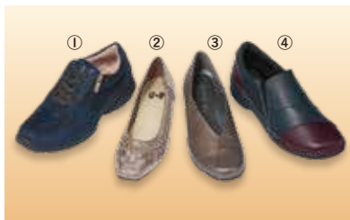
婦人靴各種 ①② 各5,500円 ③④ 各8,690円