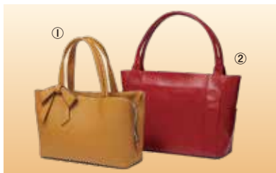
①ハンドバッグ 6,380円 ②トートバッグ 22,000円