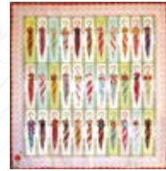
⑦ファッションブル