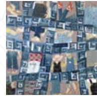
⑤ファッションブル