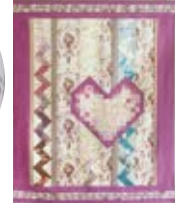
「Violà "Ma vie" 私の人生~メグの場合~」