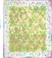
「ビバ! ユートピア Viva! Utopia」