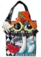
⑧ファッションブル