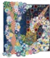
④海外コンテスト受賞作