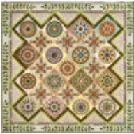
③国内・海外コンテスト受賞作