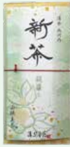
①両河内新茶八 1,620円 (100g)