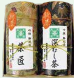
静岡県茶手揉保存会茶匠の資格を持つ大高一彦氏による特上煎茶と、熱いお湯で入れてもまろやかな深蒸し茶のセット。 新茶茶匠煎茶と深蒸し茶缶入りセット 3,240円 (150g入缶×2)