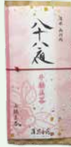
②手摘み八十八夜新茶 2,160円 (80g)