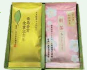
八十八夜新茶「かかやき」と最高金賞受賞記念新茶 2,268円 (100g×2袋)