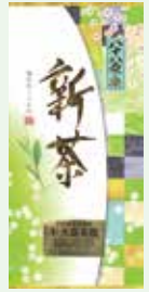
栽培農家の八十八夜新茶 1,080円 (100g)