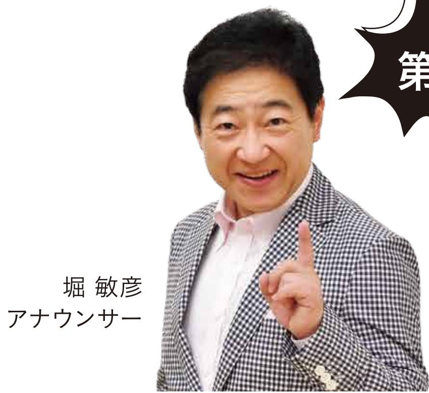
堀 敏彦 アナウンサー