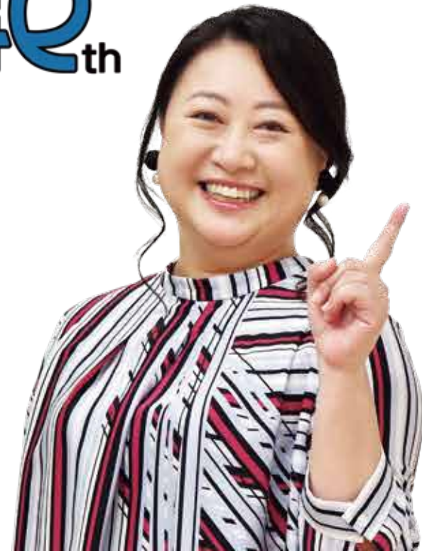
諸橋 碧 アナウンサー